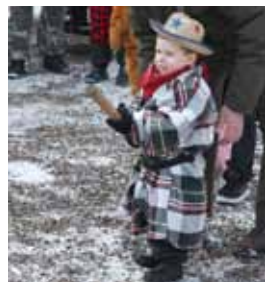
FASTELAVN I PRÆSTEGÅRDEN