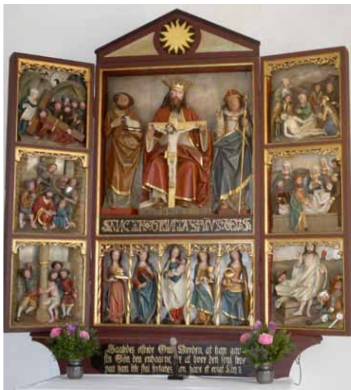
ALTERTAVLEN DATERES TIL 1520.

- fortalt af billedskæreren i alterskabets sidefløje