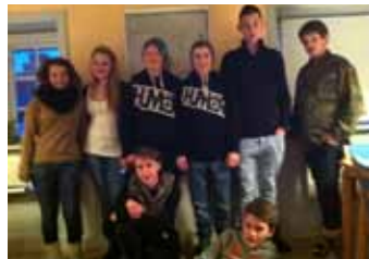
8 GLADE KONFIRMANDER

2. pinsedag er der fællesgudstjeneste med Vig i Vig præstegårdshave kl.11.00 med efterfølgende frokost.