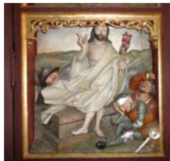
KRIST SOD OP AF DØDE, I PÅSKE- MORGENRØDE.