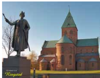
SKT. BENDTS KIRKE I RINGSTED.

mig besked, da forudbestilling er nødvendig.