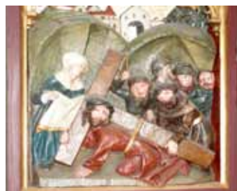
KORSBÆRINGEN DE FØRTE HAM UD TIL DET STED, DER HEDDER GOLGATA. SIMON AF KYRENE HJÆLPER MED AT BÆRE DET TUNGE KORS. VERONICA STÅR FORAN MED SVEDEDUGEN.