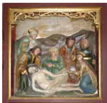
NEDTAGELSEN AF KORSET. JOSEF AF ARIMÆTÆA OG NIKODEMUS TOG JESU LEGEME NED. DE SMURTE DET MED MYRRA OG VIKLEDE LINNEDKLÆDER OMKRING DET.