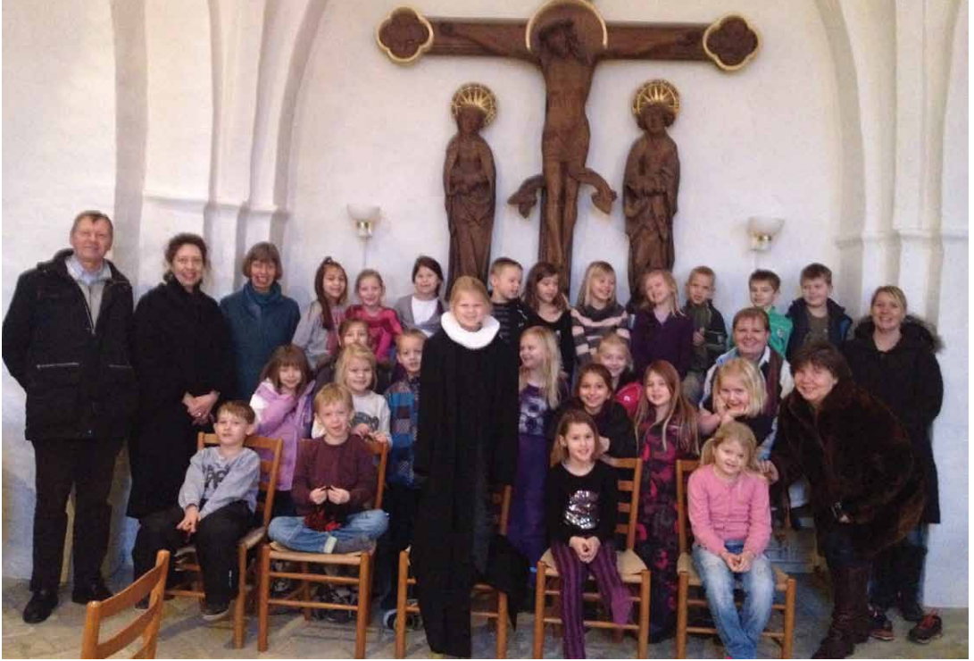
1. A og 1. B på besøg i Vig kirke, hvor vi talte om DÅBEN. Alle deres fine tegninger kan beundres i våbenhuset.