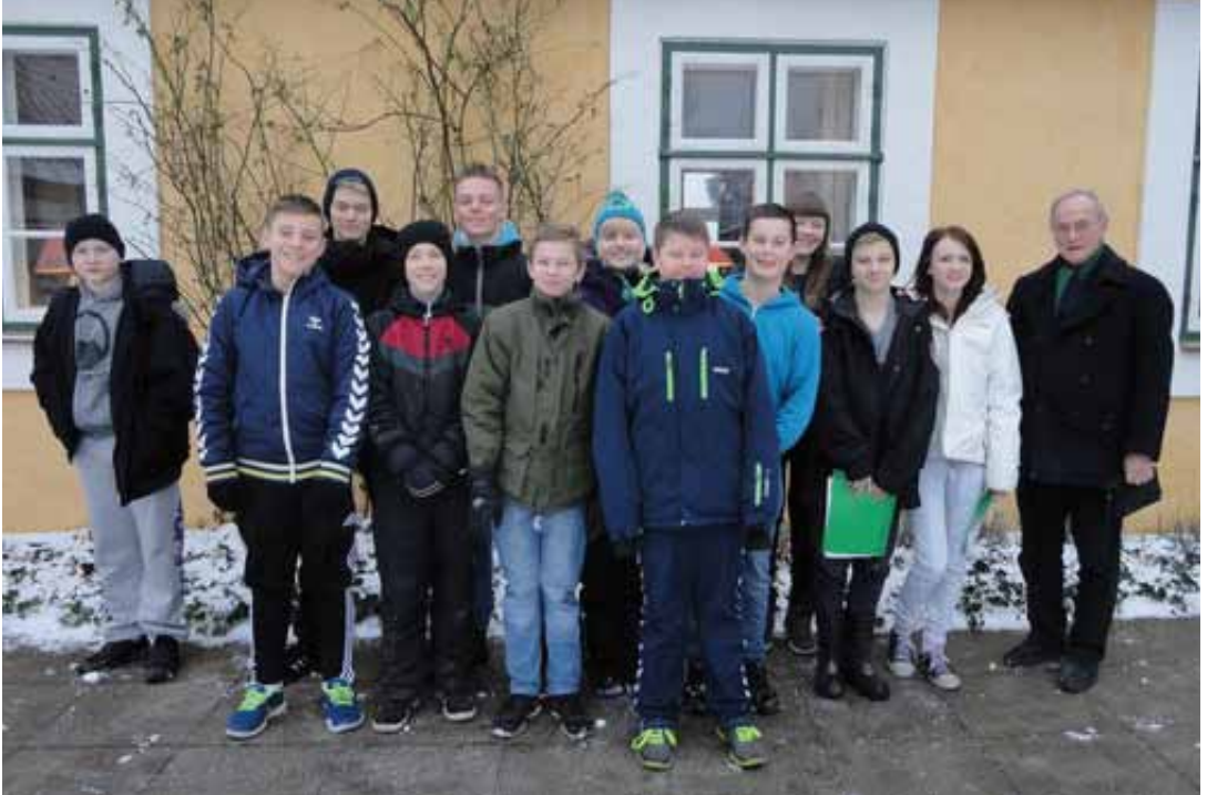
DE SMUKKE UNGE MENNESKER, DER SKAL KONFIRMERES, DEN 4. MAJ.