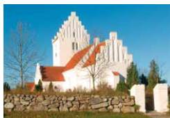
NR. ASMINDRUP KIRKE