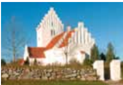
NR. ASMINDRUP KIRKE