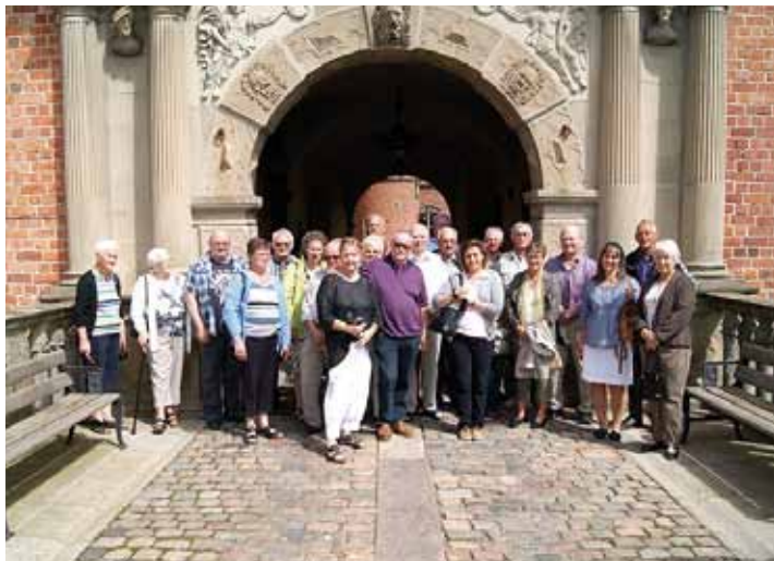
FRA UDFLUGTEN TIL VALLØ SLOT DEN 24.MAJ