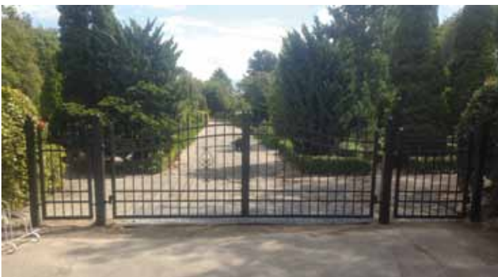
VIG NORDRE KIRKEGÅRDS NYE FLOTTE LÅGE

I stedet for blomster, vin, gave eller lignende, bliver der lavet en fælles indsamlings-”sparegris” i konfirmandstuen ;)